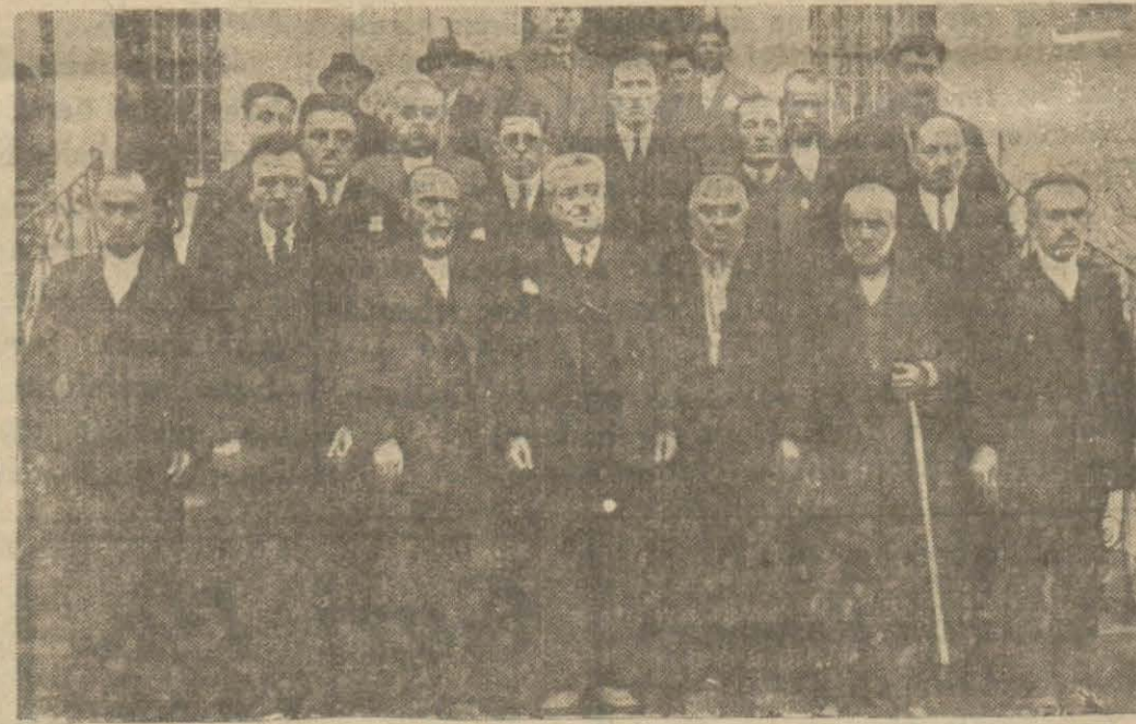
Çankırı umumi meclisinin küşat resminde azalar bir arada

Çankırı, (Husul) — Umumi Meclis içtimalarına başlamıştır. İlk içtimada encümenler intihabı yapıldıktan sonra Maarif, Nafia ve Sıhhiye raporları okunmuştur. Maarif raporuna nazaran vilâyet dahilinde 71 mektep, 128 muallim, 7 muallim kütüphanesi vardır. 34 köyde yeni mektep inşasına başlanmıştır. Sekiz millet mektebi dershanesinde 1703 vatanş okuyup yazma öğrenmektedir. İlk mektep talebesinin miktarı 4957 den 6000 e çıkmıştır.