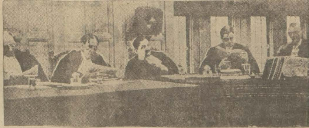
Lâhey Adalet Divanı Azaları

miserinin mümessilleri de Prusya murabhasları sıfatile iştirak etmişlerdir.