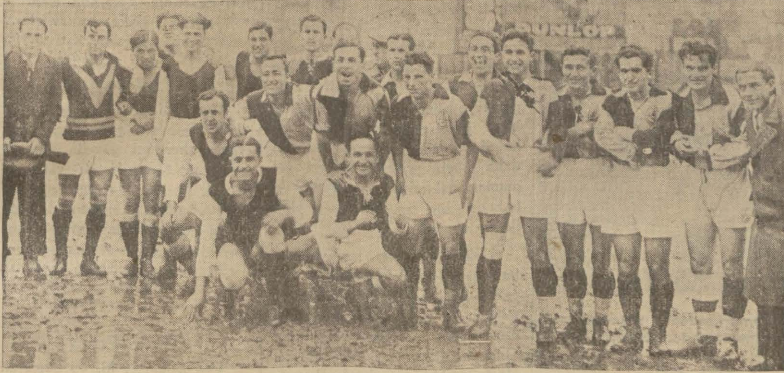
İstanbulspor - Beşiktaş Birinci Takımları Bir Arada

İstanbul mntakasının futbol lik maçları artık esaslı surette inkişaf etti, demektir. Maçların başlangıcından bugüne kadar yapılan karşılaşmalarda şampiyona için ön sırayı işgal eden kulüpler taayün etmiştir. Şimdiki hâlde şampiyonluk namzedi olarak iki takım göze çarpmaktadır. Bunlar Fenerbahçe ve Beşiktaşır.